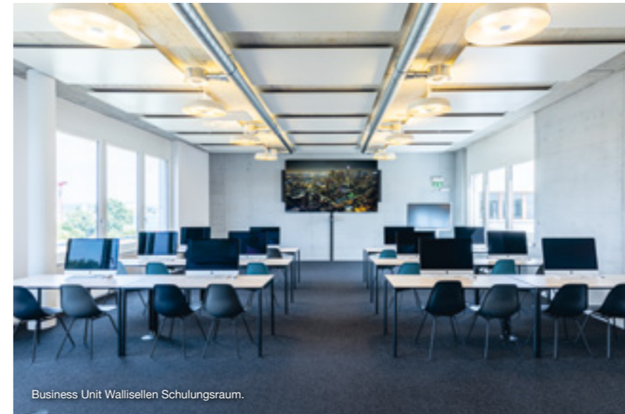
Business Unit Wallisellen Schulungsraum.

iPad 4 Kids starts in spring 2022. Pre-register for your personal child-friendly iPad now: www.dq-solutions.ch/education/ipad-for-kids