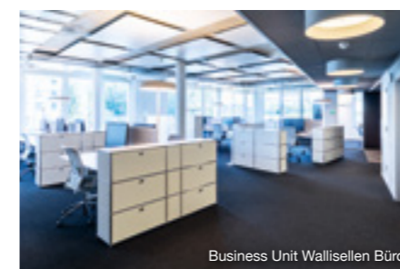
Business Unit Wallisellen Büro.